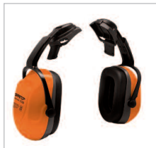
SONICO SET Ref. 82805 SNR 30 DB Ajustable en altura. Válido para largos periodosde uso. Copas muy suaves. Sin partes metálicas. Ajuste perfecto.