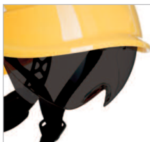
VISOR AHUMADO REF. 80639 Visor ahumado antivaho Clase óptica 1 Anti-impacto