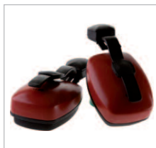
CLIPTON Ref. 82910 SNR 24 DB Protector auditivo ajustable en altura y separación. Almohadillas extra suaves para la piel. Válido para largos periodos de uso. Alta protección para trabajos en áreas ruidosas, donde deben llevarse también cascos de protección.