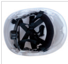
SUSPENSIÓN REF. 80649 Suspensión para casco Montana (sin barboquejo)