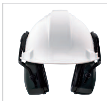
THUNDER T2H Ref. 82804 SNR 30 DB Protector auditivo DIELECTRICO, adecuado para todos los lugares de trabajo, especialmente para entornos eléctricos. Extra confort durante largos periodos de uso. Su carcasa externa lo hace óptimo para los lugares de trabajo más duros.