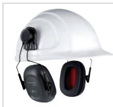
LEIGHNING L1H Ref. 82805 SNR 28 DB Cápsulas de ABS montadas sobre un dispositivo que se introduce en las ranuras de los cascos A Safe. Muy ligero: solo 171 g. Se acopla perfectamente al casco y ofrece una perfecta estabilidad en su colocación.