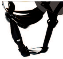
BARBOQUEJO REF.80051 Barboquejo de repuesto de 4 puntos