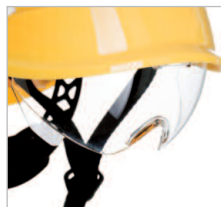
VISOR CLARO REF. 80638 Visor claro antivaho Clase óptica 1 Anti-impacto